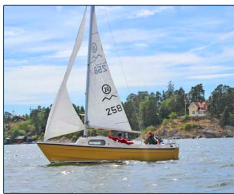
Hårdare vind - revat några varv

Om det friskar i ordentligt kan man reva några varv på storseglet och nyttja stormfock eller rulla in några varv på focken också.