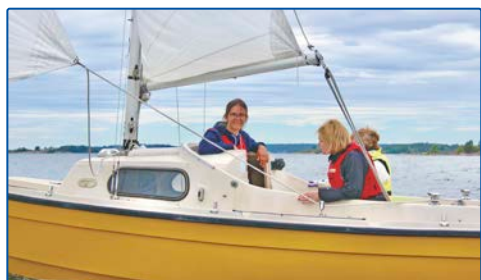
Instruktör och gästar

Båten har stor sittbrunn - den tar tre elever – instruktören kan stå i ruffen. Varje elev har en klar uppgift: en rorsman och två gästar.