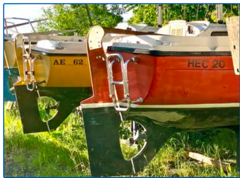
MS20 på land

Båten sticker endast 0,9 meter. Med gynnsam belysning (medljus) ser man grunden (utkik på fördäck). Har man inte ekolod så duger en lång båtshake eller åra bra som "lod".