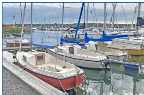
MS20 i NSS hemmahamn i Arkösund

Med MS 20 kan eleverna lära sig att segla båten och att köra den för motor.